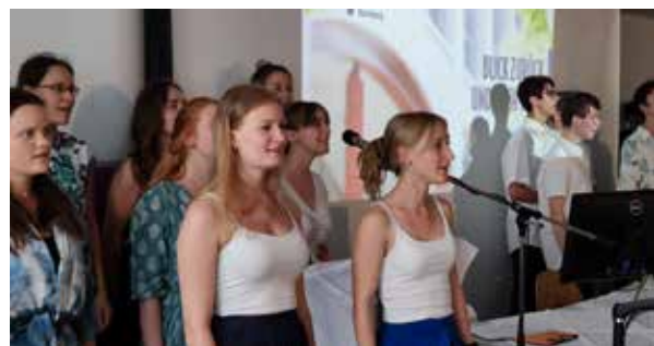
Beim Jubiläum „25 Jahre unter einem Dach“ trat auch der gemeinsame Chor der TH Nürnberg und der EVHN auf.

Markus Blume MdL, Bayerischer Staatsminister für Wissenschaft und Kunst